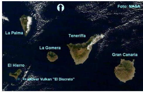
Die westlichen Kanarischen Inseln