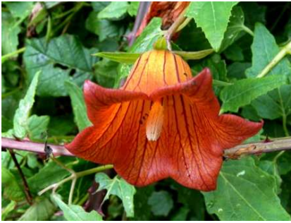
Kanaren-Glockenblume Canaria canariensis

Die „ Stufe über den Wolken “ (kühl und trocken); bis rund 2400 m: Hochgebirgs-Halbwüste dominiert von bestandsbildendem Klebrigem Drüsenginster ( Adenocarpus viscosus ).