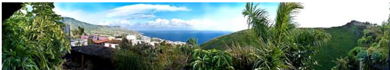
Ausblick vom Zoo Maroparque oberhalb der Hauptstadt Santa Cruz de La Palma

Neben der fachlichen Qualifikation und der Erfahrung schätzen die Reisetilnehmer seit vielen Jahren das didaktische Geschick, die allgemein verständliche Wissensvermittlung im ganzheitlichen naturkundlichen Kontext und die umgängliche Art dieses Führerteams.