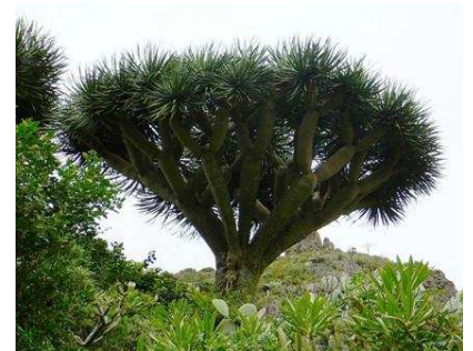
Drachenbaum Dracaena draco

La Palma zählt sich zu den drei schönsten Inseln der Welt. Über 120 Vulkane bilden den Südteil der Insel. Einige von ihnen waren noch in den Jahren 1949 und 1971 aktiv. Aus dem Vulkan Teneguia treten immer noch heiße Gase aus. Der Wanderer durchquert hier bizarre Vulkanlandschaften auf einem Boden, der überwiegend aus vulkanischer Asche (Lapili) besteht.